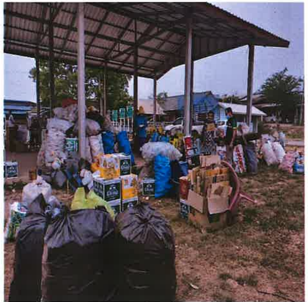
ภาพประกอบครัวเรือนที่เข้าร่วมกิจกรรม