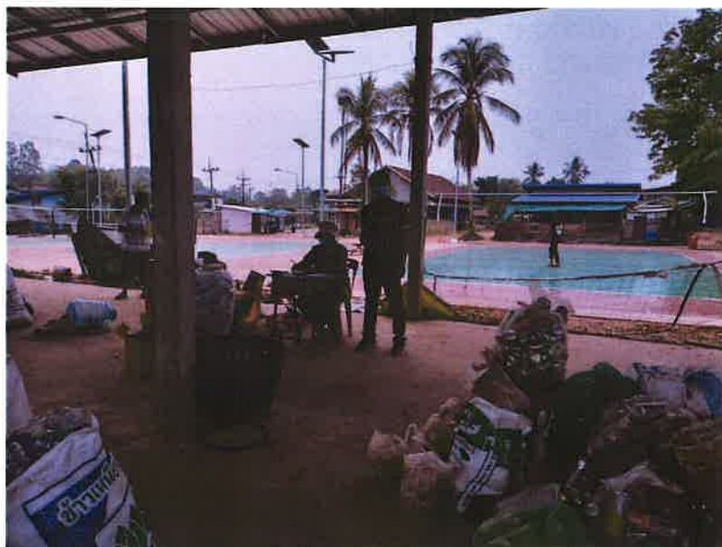
ภาพประกอบครัวเรือนที่เข้าร่วมกิจกรรม