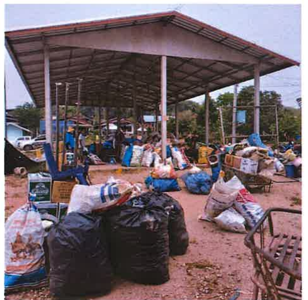
ภาพประกอบครัวเรือนที่เข้าร่วมกิจกรรม