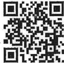
แบบกรอกประวัติ 2 แบบ